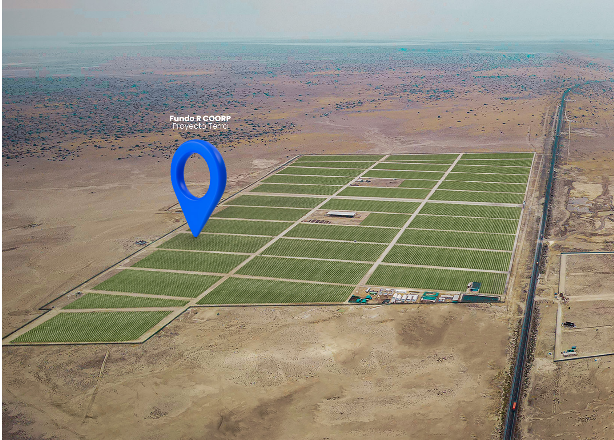
Fundo R COORP Proyecto Terra